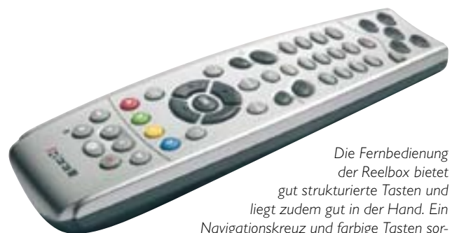
Die Fernbedienung der Reelbox bietet gut strukturierte Tasten und liegt zudem gut in der Hand. Ein Navigationskreuz und farbige Tasten sorgen für eine einfache und schnelle Steuerung aller Funktionen der Reelbox.

Für Besitzer der Reelbox Light, die bereits mit der Anschaffung einer Avantgarde geliebäugelt haben, gibt es eine gute Nachricht: Seit Anfang April gewährt der Hersteller Besitzern der Reelbox Light einen Treuebonus. Diese können nun die Avantgarde für circa € 1.000,-, statt der üblichen rund € 1450,- (durchschnittlicher Marktpreis) erwerben.