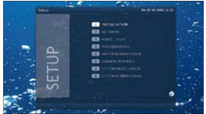
Im neuen Gewand präsentiert sich die Benutzeroberfläche der Reelbox Avantgarde. Das Redesign hat dem Multimediacenter gut getan und erleichtert die alltägliche Bedienung ungemein.

Hierzu sind im Internet auf einschlägigen Seiten bereits Softwareversionen verfügbar, die allerdings nicht vom Hersteller unterstützt werden.