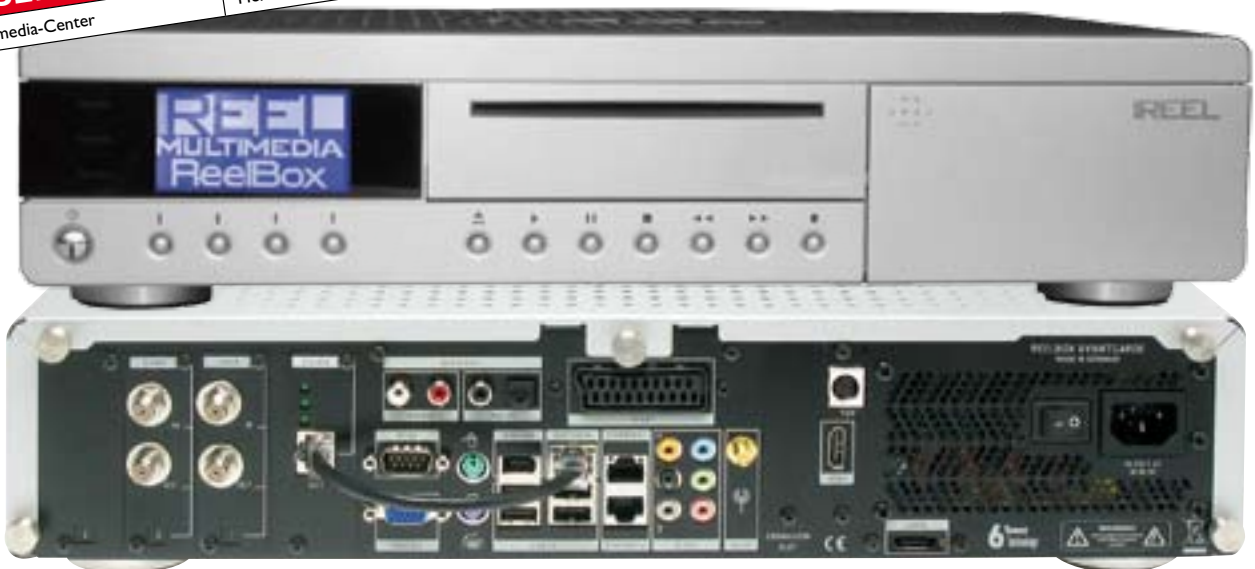
An den ohnehin umfangreichen Anschlussmöglichkeiten hat sich nichts geändert. Erfreulich ist allerdings, dass inzwischen auch die CI-Schächte funktionieren.