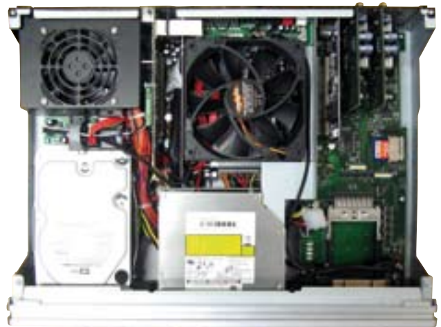
Ab Werk zunächst nur zum Archivieren und zur Wiedergabe nicht kopiergeschützter DVDs geeignet: Das DVD-Laufwerk in der Reelbox krank an fehlenden Lizenzen.

Für Besitzer der Reelbox Light, die bereits mit der Anschaffung einer Avantgarde geliebäugelt haben, gibt es eine gute Nachricht: Seit Anfang April gewährt der Hersteller Besitzern der Reelbox Light einen Treuebonus. Diese können nun die Avantgarde für circa € 1.000,-, statt der üblichen rund € 1450,- (durchschnittlicher Marktpreis) erwerben.